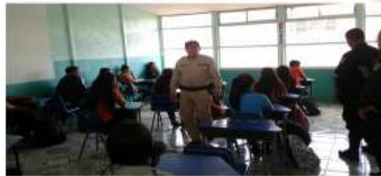
Fuerza Publica de Costa Rica Hermanos de Servicio