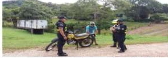
Fuerza Pública de Costa Rica Mareas de Servicio