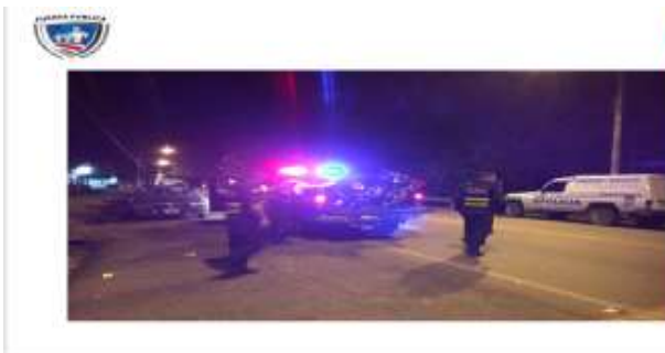
Fuerza Pública de Costa Rica Mareas de Servicio

En Colorado, Barrio Ochoa, se realiza el decomiso de 28 gramos aproximadamente de aparente droga cocaína, 03 gramos aproximadamente de aparente droga cocaína (pasta), 04 puntas de aparente droga cocaína, 15 envoltorios de papel aluminio conteniendo aparente droga crack, 09 gramos de aparente droga crack (cajeta), la suma de 143.000 colones, 02 dólares, a un sujeto Melirano Obando conocido como cuto león, el cual fue pasado a la fiscalía de turno, esto el sábado 10 de noviembre del 2018