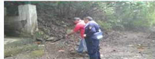
Fuerza Publica de Costa Rica Hermanos de Servicio