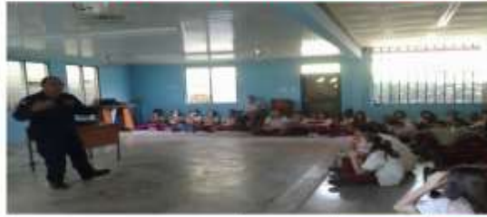
Fuerza Publica de Costa Rica Hermanos de Servicio