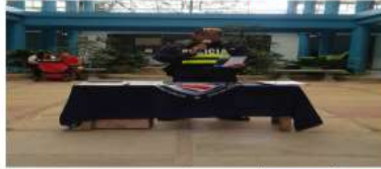
Fuerza Publica de Costa Rica Hermanos de Servicio